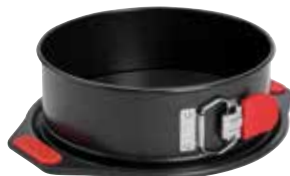
Moule à manqué à charnière À partir de 29€90 le 20 cm