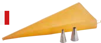
Poche à douille silicone + 2 douilles DE BUYER 27€