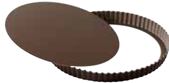
Moule à tarte fond amovible À partir de 13€50 le 20 cm