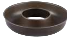
Moule à savarin débouché 24 cm 22€90