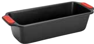
Moule à cake 28 cm 24€90