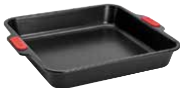
Moule à gâteau carré 28 x 28 cm 29€90