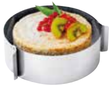
Cercle à pâtisserie réglable KAISER 31€90