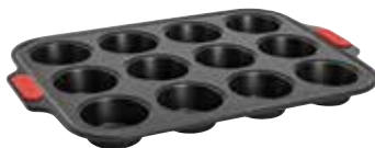
Moule à muffins 39€90