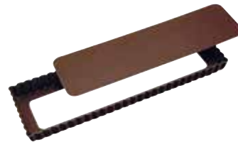
Moule à tarte fond amovible 35 cm 19€90